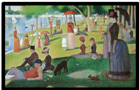
Georges Seurat « un dimanche après-midi à l'île de la Grande Jatte »

Comme le petit garçon, visite ce musée et laisse toi t'évader devant ces 2 tableaux.